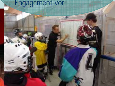
EHC Moskitos Essen e.V.

„Dafür engagiere ich mich!“ – Mitarbeiter/innen stellen im Intra- und Internet ihr privates Engagement vor