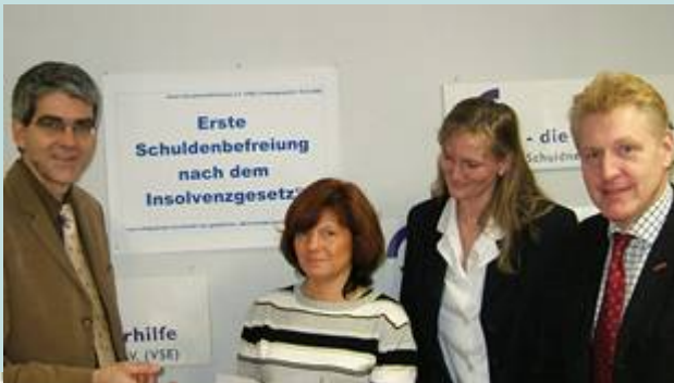
Verein Schuldnerhilfe e.V.