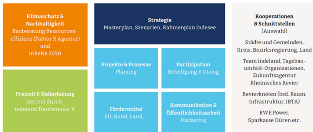
Abbildung 2: Handlungsfelder der indeland GmbH.

Im Strukturwandelprozess vertritt die indeland GmbH die Interessen ihrer Gesellschafterkommunen und versteht sich als Impulsgeber für das gesamte Rheinische Revier. Gemeinsam mit den Städten und Gemeinden, dem Kreis Düren und regionalen Partnern erarbeitet die Gesellschaft Entwicklungskonzepte für Fokusräume, entwickelt Projekte und setzt diese um. Die Akquise von Fördermitteln und Investitionen unterstützt die Kommunen bei der Bewältigung des Strukturwandels. Die Arbeit zielt auf die Vernetzung und Kooperation innerhalb der Region, die Kooperation mit Wissenschaft und Bürgerschaft und auf die Schaffung einer eigenen Identität und die Verbesserung des Images der Region durch deren nachhaltige Transformation ab. In der Abbildung 2 sind die Handlungsfelder der indeland GmbH mit beispielhaften Projekten dargestellt.